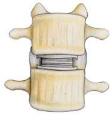
Prothèse de disque