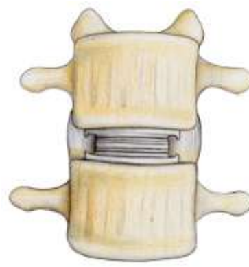
Prothèse de disque